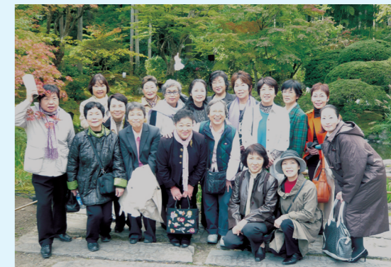
▲後列右から4人目筆者