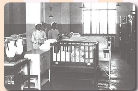
▲慶應義塾史事典より